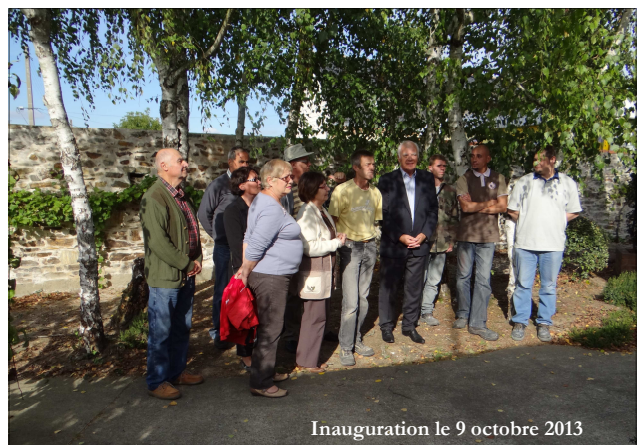
Inauguration le 9 octobre 2013