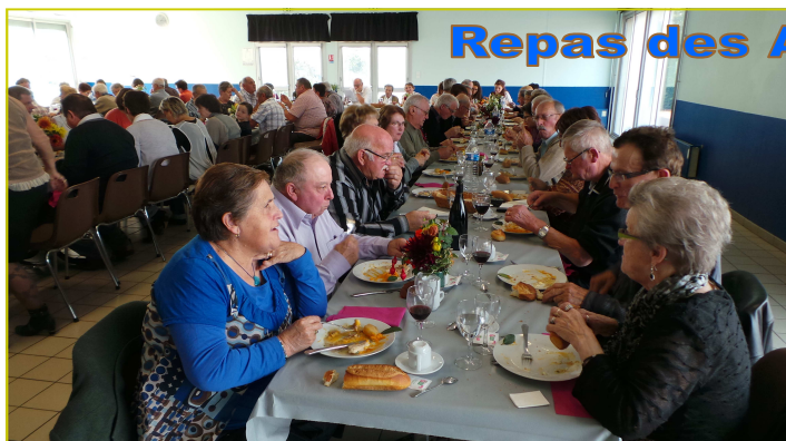
Repas des Aînés le 13 octobre 2013