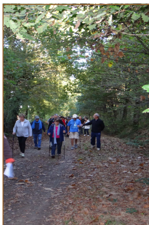
Balade du Patrimoine