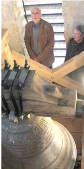
Mairie de La Plaine

Disposant d'un beffroi tout neuf et d'une cloche restaurée, l'église communale a ouvert ses portes aux visiteurs. D'autres lieux de culte étaient également concernés.