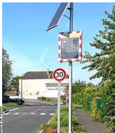
Mairie de Vezins

Soucieuse de la sécurité routière, la Municipalité de Vezins a fait l'acquisition d'un radar pédagogique qui se déplace, depuis un peu plus d'un an, sur tous les axes sensibles de la commune.